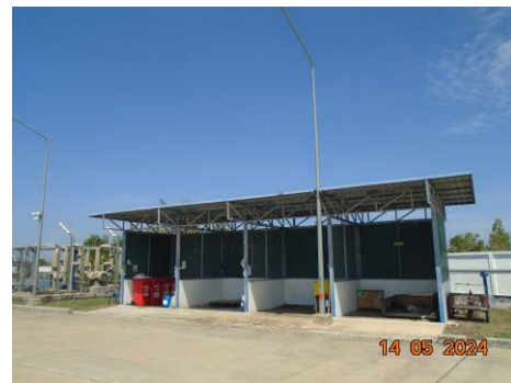
ภาพที่ 2-21 สถานที่จัดเก็บมูลฝอยและกากของเสีย