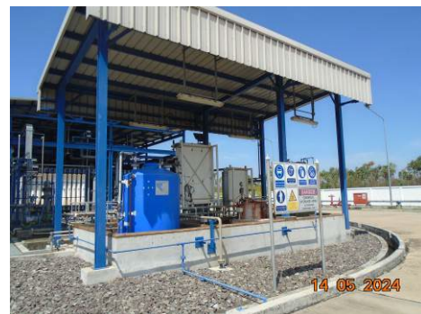
ภาพที่ 2-48 อาคาร/แทงค์จัดเก็บสารเคมีอันตราย