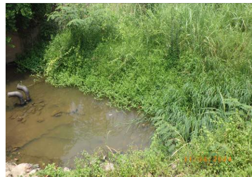
ภาพที่ 2-16 ระบบท่อระบายน้ำทิ้งจากโครงการไปยังคลองชุมพล (บริเวณฝ่ายทยายศร)