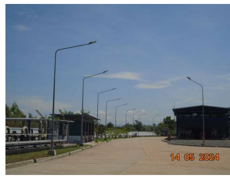
ภาพที่ 2-37 ระบบไฟฟ้าแสงสว่าง