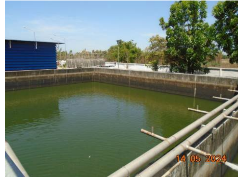
ภาพที่ 2-14 บ่อพักน้ำทิ้งของโรงไฟฟ้า