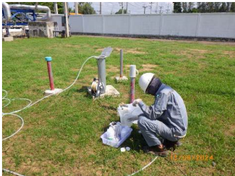
ภาพที่ 2-18 การตรวจวัดคุณภาพน้ำใต้ดิน