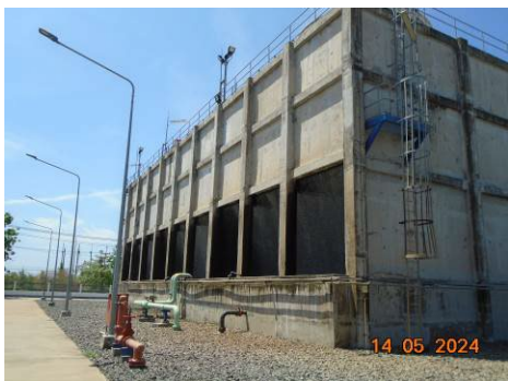
ภาพที่ 2-1 หอหล่อเย็น (Cooling Tower)