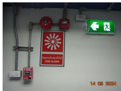
ภาพที่ 2-39 ระบบป้องกันเพลิงไหม้ และระบบดับเพลิง