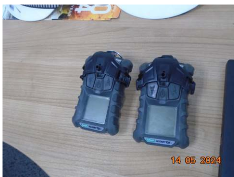
ภาพที่ 2-42 Portable Gas Detector