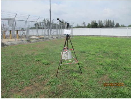
ภาพที่ 2-7 การตรวจวัดระดับเสียงบริเวณริมรั้วโรงไฟฟ้า