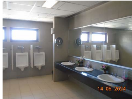
ภาพที่ 2-12 ห้องส้วมที่ถูกหลักสุขาภิบาล