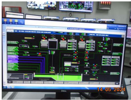
ภาพที่ 2-15 ระบบควบคุมคุณภาพของน้ำทิ้งที่ผ่านหอหล่อเย็น