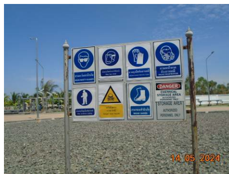
ภาพที่ 2-41 ป้ายสัญลักษณ์เตือนในพื้นที่โรงไฟฟ้า