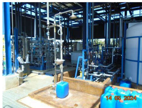
ภาพที่ 2-52 Emergency Eye Shower and Washer