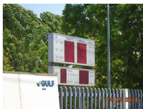
ภาพที่ 2-4 จอแสดงผลการตรวจวัดคุณภาพอากาศจากปล่อง ระบายบริเวณหน้าโรงไฟฟ้า