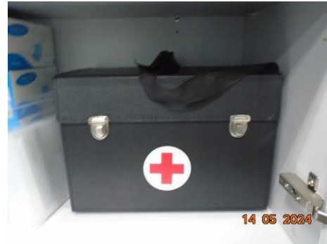
ภาพที่ 2-35 เครื่องมือและเวชภัณฑ์สำหรับการปฐมพยาบาลเบื้องต้น