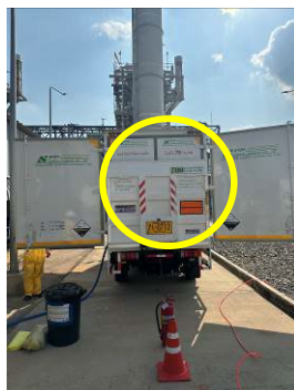
ภาพที่ 2-28 การติดเครื่องหมาย ป้ายวัตถุอันตราย และเบอร์โทรศัพท์ที่ตัวถังของรถบรรทุกสารเคมี