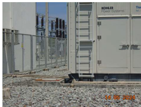
ภาพที่ 2-32 ระบบรวบรวมน้ำฝนและท่อระบายน้ำ ภายในพื้นที่ปนเปื้อน