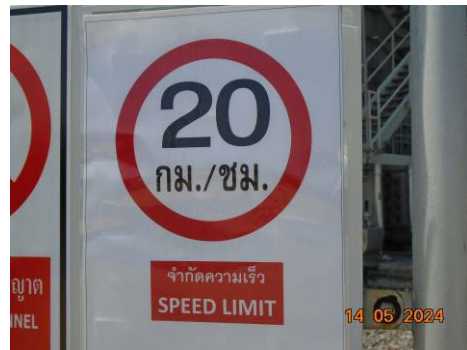
ภาพที่ 2-25 ป้ายจำกัดความเร็วภายในโรงไฟฟ้า