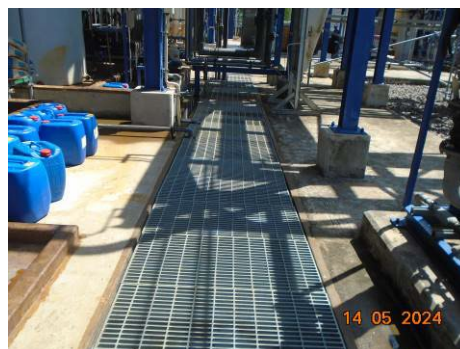
ภาพที่ 2-54 รางระบายบริเวณสถานที่เก็บสารเคมีอันตราย