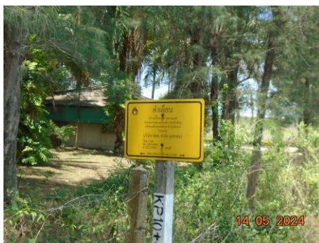
ภาพที่ 2-44 ป้ายคำเตือนและเบอร์โทรศัพท์ติดต่อบริเวณท่อส่งก๊าซธรรมชาติ