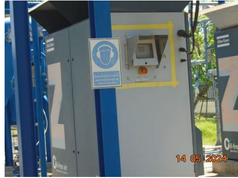
ภาพที่ 2-8 ป้ายสัญลักษณ์เตือนให้สวมใส่อุปกรณ์ป้องกันเสียง