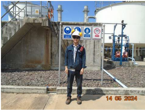
ภาพที่ 2-9 พนักงานสวมใส่อุปกรณ์คุ้มครองความปลอดภัยส่วนบุคคล