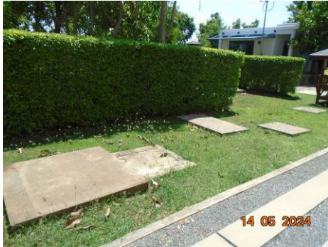
ภาพที่ 2-13 บ่อเกรอะหรือถังบำบัดน้ำเสียสำเร็จรูป