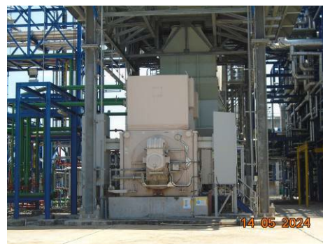
ภาพที่ 2-6 อาคารคลุมเครื่องจักรที่มีเสียงดัง