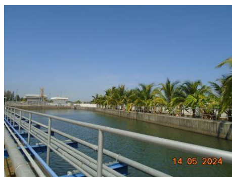
ภาพที่ 2-30 บ่อพักน้ำฝนบริเวณพื้นที่โรงไฟฟ้า