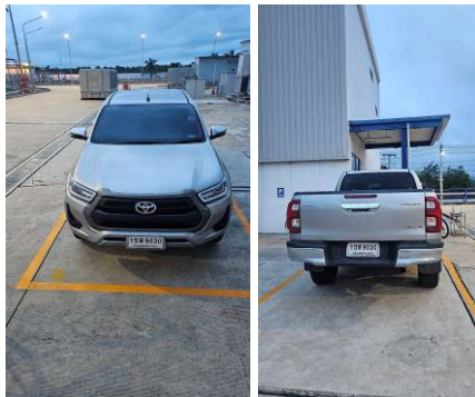
ภาพที่ 2-36 รถรับส่งในกรณีฉุกเฉิน