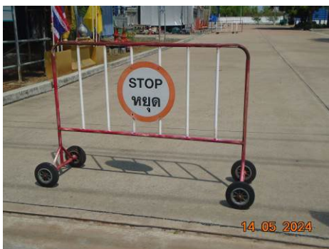
ภาพที่ 2-26 ป้ายห้ามนำยานพาหนะเข้ากระบวนการผลิต