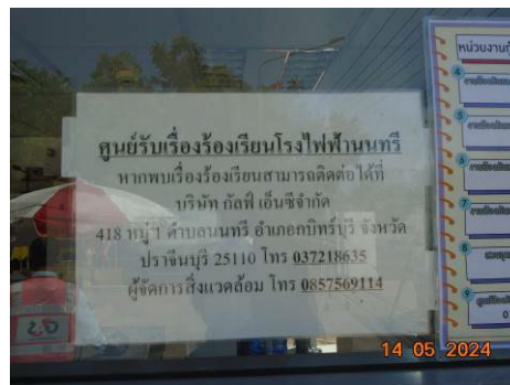
ภาพที่ 2-2 ศูนย์รับเรื่องร้องเรียน