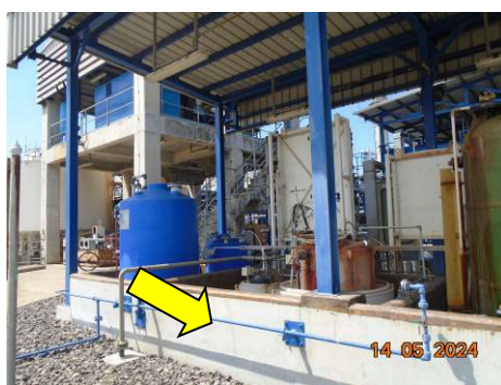
ภาพที่ 2-55 คันกัน (Dike) บริเวณสถานที่เก็บสารเคมี