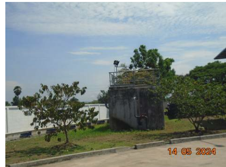
ภาพที่ 2-19 บ่อแยกน้ำ/น้ำมัน (Oil Separator)