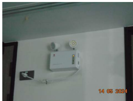
ภาพที่ 2-38 ระบบไฟฟ้าสำรอง