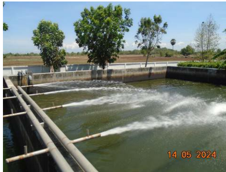
ภาพที่ 2-17 ระบบกระจายน้ำบริเวณจุดปล่อยน้ำลงสู่บ่อพักน้ำทิ้ง