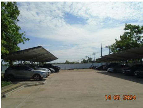
ภาพที่ 2-24 พื้นที่ลานจอดรถ