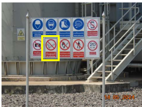
ภาพที่ 2-40 ป้ายเขตห้ามสูบบุหรี่/ห้ามก่อประกายไฟ