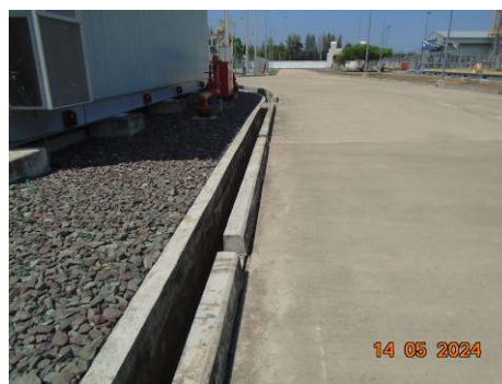
ภาพที่ 2-33 แนวเขตท่อระบายน้ำทิ้งและท่อระบายน้ำฝน