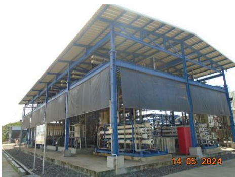
ภาพที่ 2-53 สถานที่เก็บสารเคมีที่มีระบบระบายอากาศที่เหมาะสม