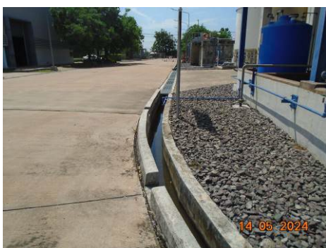
ภาพที่ 2-29 ระบบรวบรวมน้ำฝนและท่อระบายน้ำของโรงไฟฟ้า