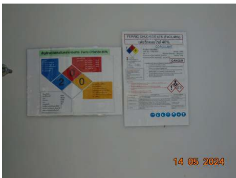
ภาพที่ 2-47 เอกสารข้อมูลความปลอดภัยของสารเคมี (SDS) บริเวณพื้นที่ปฏิบัติงาน