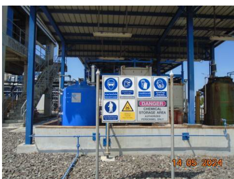
ภาพที่ 2-49 ป้ายเตือนในการทำงานเกี่ยวกับสารเคมี