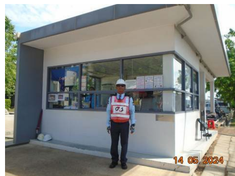
ภาพที่ 2-27 เจ้าหน้าที่รักษาความปลอดภัย