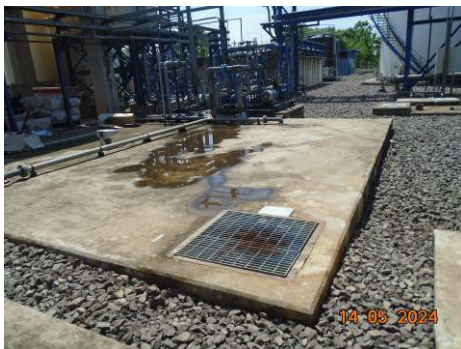
ภาพที่ 2-20 บ่อปรับสภาพความเป็นกรด-ด่าง (Neutralization Pit)