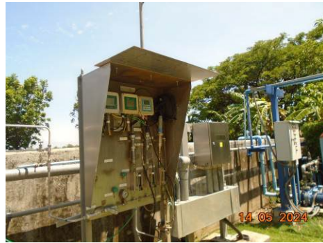
ภาพที่ 2-10 ระบบติดตามตรวจสอบคุณภาพน้ำทิ้งแบบต่อเนื่อง (Online Monitoring) บริเวณจุดระบายน้ำทิ้งของโครงการ