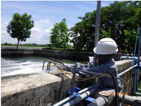
ภาพที่ 2-11 การตรวจวัดคุณภาพน้ำทิ้งแบบครั้งคราว บริเวณจุดระบายน้ำทิ้งของโครงการ