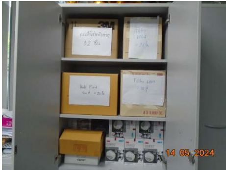
ภาพที่ 2-34 การจัดเตรียมอุปกรณ์คุ้มครองความปลอดภัยส่วนบุคคลให้กับพนักงาน