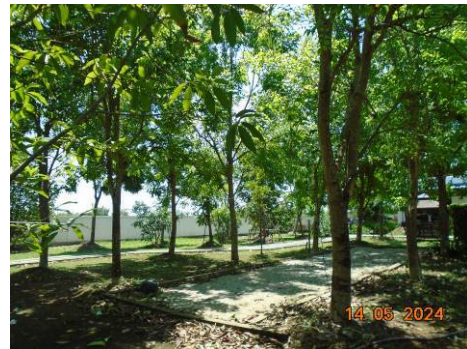
ภาพที่ 2-56 พื้นที่สีเขียวของโรงไฟฟ้า