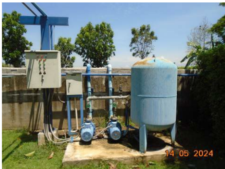
ภาพที่ 2-57 ระบบปั๊มน้ำจากบ่อกักน้ำทิ้งมารดน้ำต้นไม้ ในพื้นที่โรงไฟฟ้า