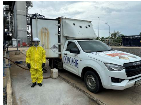
ภาพที่ 2-46 อุปกรณ์คุ้มครองความปลอดภัยส่วนบุคคลประจำรถ ขนส่งสารเคมีหรือวัตถุอันตราย