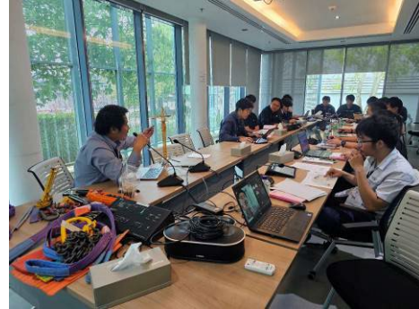
ภาพที่ 2-23 การอบรมความปลอดภัยให้แก่พนักงาน