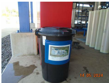
ภาพที่ 2-51 อุปกรณ์และชุดป้องกันสารเคมี