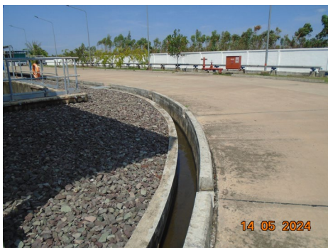
ภาพที่ 2-31 การทำความสะอาดทางระบายน้ำในพื้นที่โรงไฟฟ้า