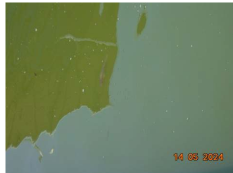
ภาพที่ 2-58 บ่อเลี้ยงปลา (น้ำทิ้ง และน้ำธรรมชาติ)