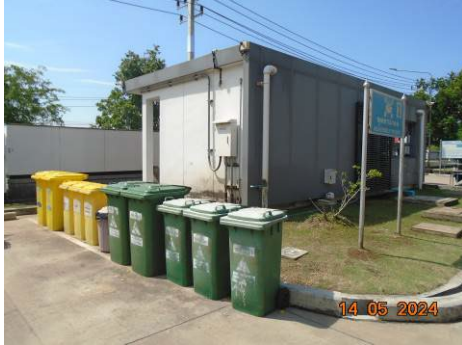
ภาพที่ 2-22 ถังขยะแยกประเภท