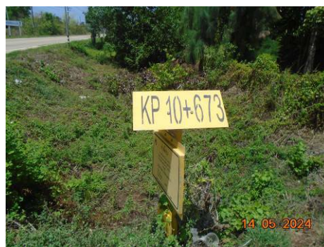
ภาพที่ 2-43 ป้ายแนวท่อและขอบเขตพื้นที่ข้างแนวท่อส่งก๊าซ ธรรมชาติ