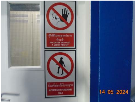
ภาพที่ 2-45 ป้ายเตือนเขตหวงห้าม