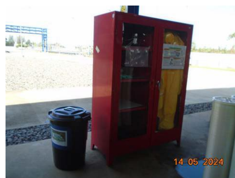
ภาพที่ 2-50 ตู้เก็บอุปกรณ์และชุดป้องกันสารเคมี